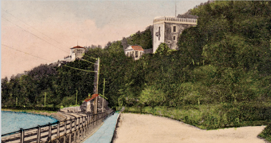
Engstelle Klause bei Lochau, 1902.

danke durch den Kopf, ob das Herrscherpaar jemals etwas von den Schwabenkindern gehört haben mochte, die über Jahrhunderte hinweg nur ein paar Steinwürfe von hier entfernt in die Fremde zogen? Wohl eher nicht ... Am Bahnhof Lochau und der als Restaurant genutzten »Alten Fähre« vorbei, bleiben wir geradeaus weiter bis zum Bahnübergang. Hier befindet sich linker Hand eine öffentliche Toilette. Nun teilen sich die Wege: entweder weiter auf der Route A2 in Richtung Lindau und nach Tettngang oder nach rechts auf den Routen A1 und A3 bis nach Hangnau, wo sich die Wege wieder gabeln. Wer nach Hörbranz will, folgt ebenfalls der Route A1. Wer nicht in Bregenz übernachten oder den nächsten Wegabschnitt auf A1 verkürzen möchte, dem bietet sich in beiden Gemeinden eine Anzahl von Unterkünften an. Ein Abstecher nach Hörbranz-Ortsmitte (siehe unten) empfiehlt sich nur zur Übernachtung bei den Routen A1 und A3.