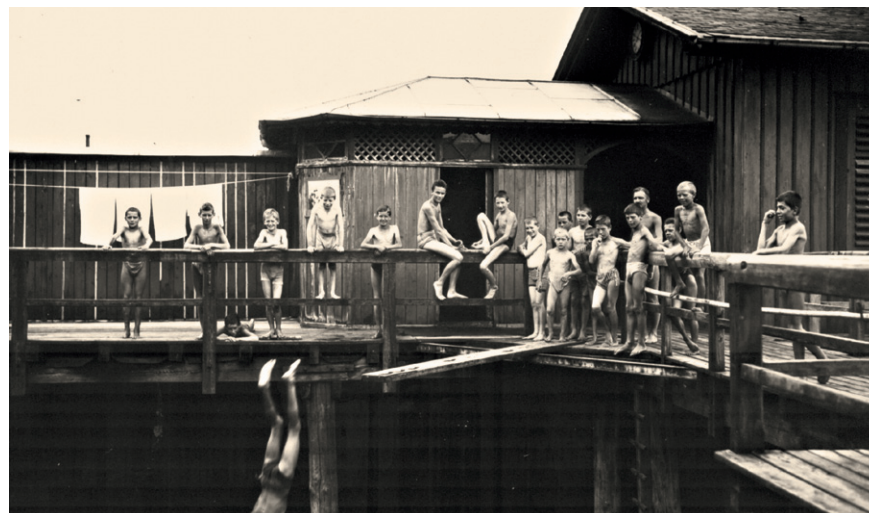
Bregenzer Buben in der »Mili«.

453 04, Fax 421 68-44, tourismus@lochau.cnv.at, www.tiscover.com/lochau. – Hörbranz: Hörbranz Tourismus, Lindauer Straße 58, A-6912 Hörbranz, Tel. +43 (0) 5573/822 22-111, Fax 822 22-4, gemeinde@hoerbranz.at. – Lindau-Zech: Prolindau Marketing GmbH, Alfred-Nobel-Platz 1, D-88131 Lindau, Tel. +49 (0) 8382/2600-30, Fax 2600-55, reservierung@prolindau.de, www.prolindau.de, www.lindau.de. – Bösenreutin: Fremdenverkehrsamt Sigmarshöfen, Hauptstraße 28, D-88138 Sigmarshöfen, Tel. +49 (0) 8389/9203-17, Fax 9203-49, www.sigmarshöfen.de. – Weißensberg: Gemeindeverwaltung Weißensberg, Kirchstraße 13, D-88138 Weißensberg, Tel. +49 (0) 8389/278, Fax 8217, gemeinde@weissensberg.de, www.weissensberg.de. – Esseratsweiler: www.achberg.de. – Dietmannsweiler: Tourist-InfoBüro TIB: Tel. +49 (0) 7542/510-500, tourist-info@tett nang.de, www.tett nang.de. – Ravensburg: Tourist Information Ravensburg, Kirchstraße 16, D-88212 Ravensburg, Tel. +49 (0) 751/82-800, Fax 82-466, tourist-info@ravensburg.de, www.ravensburg.de.