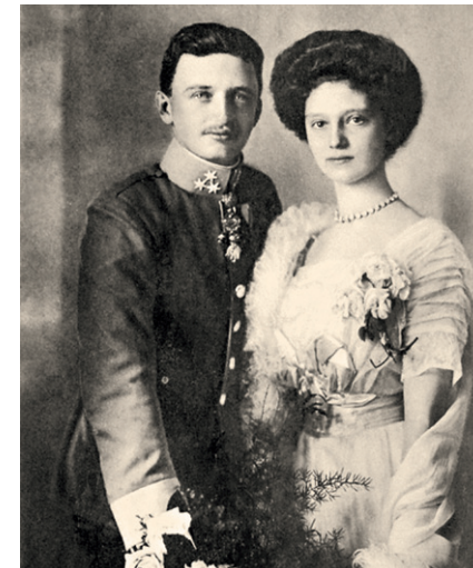
Karl I. (1887–1922) und Zita (1892–1989). Die letzte österreichische Kaiserin starb in Zizers/Schweiz. Ihr Leichnam ruht in der Kapuzinergruft in Wien, das Herz befindet sich im schweizerischen Kloster Muri.

Nach knapp 3 km folgen wir der gelb-weißen Beschilderung nach links hin zum See, entlang dem auf dem ehemaligen Kasernengelände neu erbauten Hotelkomplexes »Kaiserstrand«. Die Namensgebung geht zurück auf einen Besuch Kaiser Karls und seiner Gemahlin Zita 1917, der diesen Platz als schönsten Strand Österreichs bezeichnete. Vielleicht geht uns dabei der Ge-